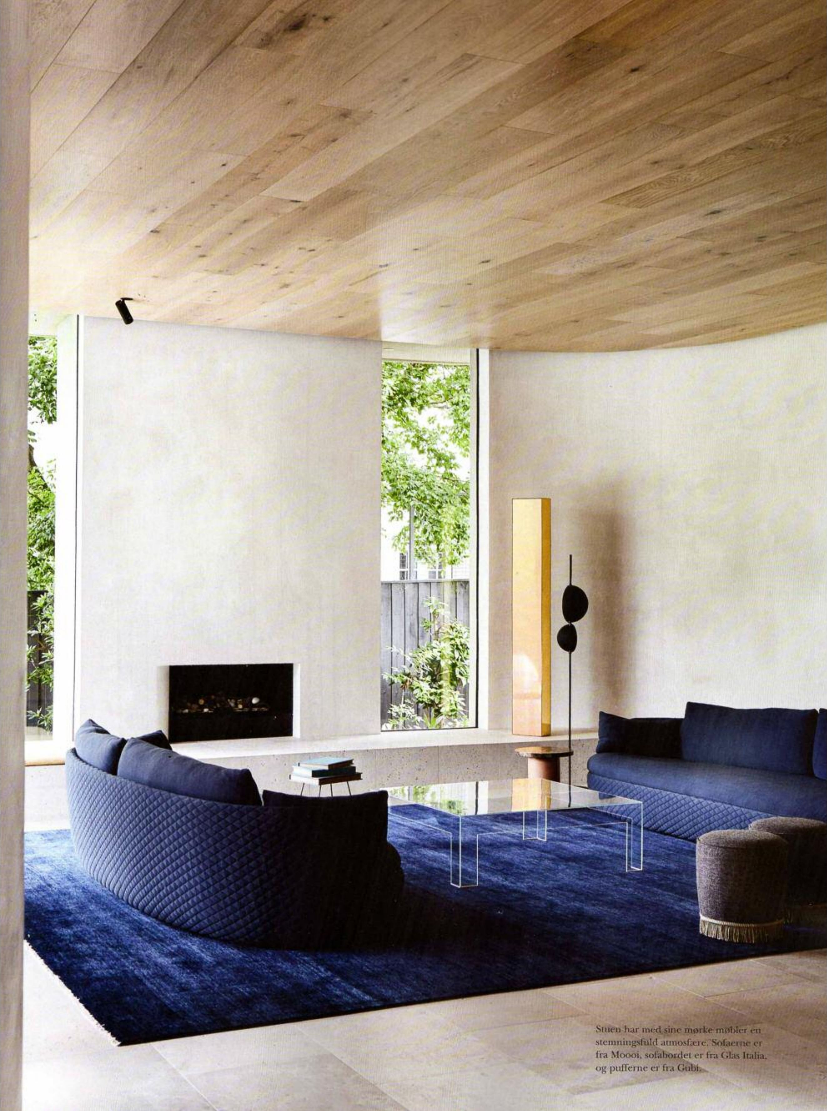
Stuen har med sine mørke møbler en stemningsfuld atmosfære. Sofaerne er fra Moooi, sofabordet er fra Glas Italia, og pufferne er fra Gubi.