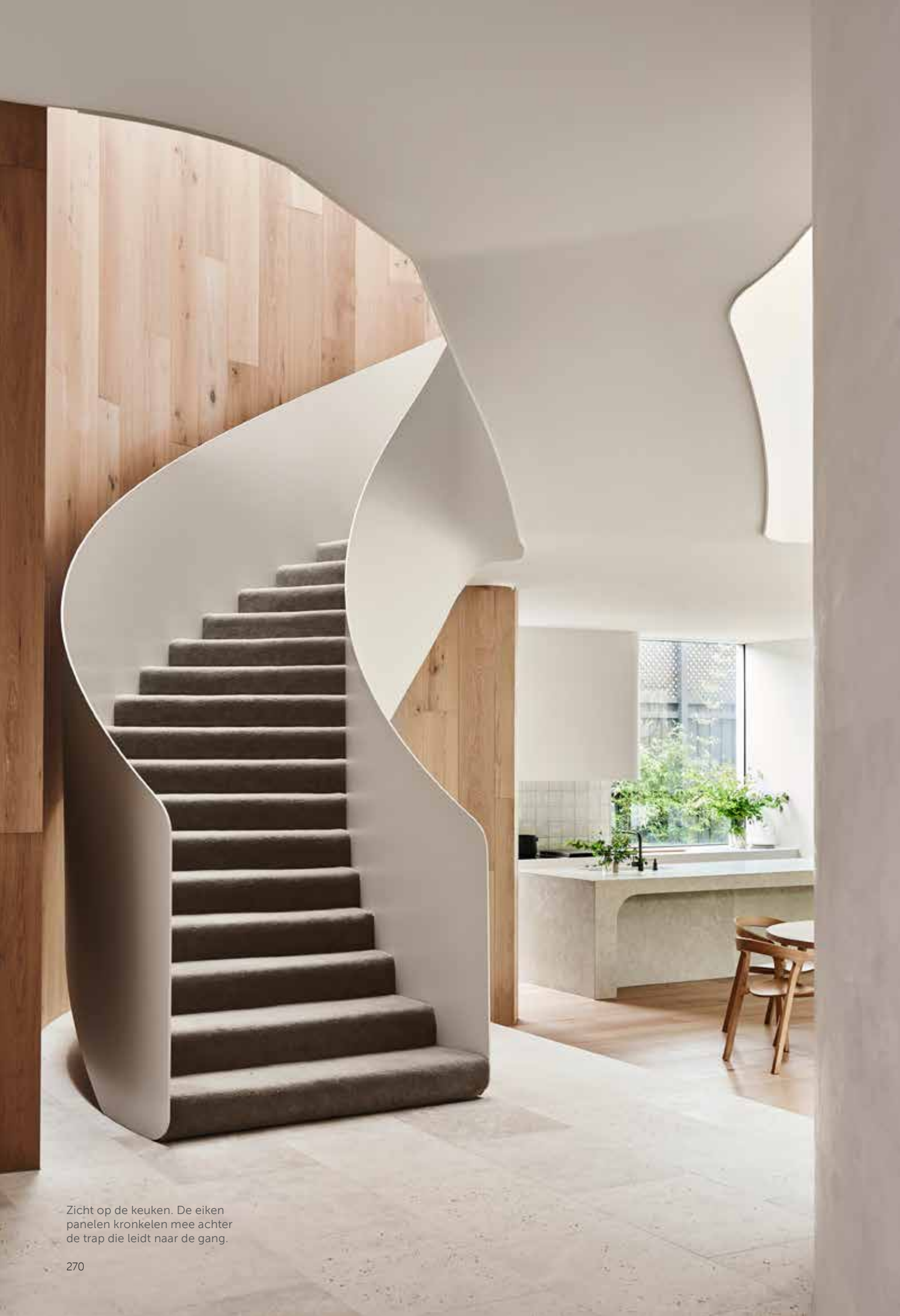
Zicht op de keuken. De eiken panelen kronkelen mee achter de trap die leidt naar de gang.